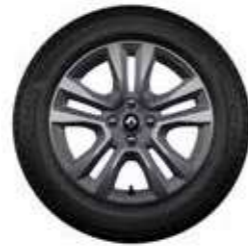
Rin de aluminio Jogger 16"